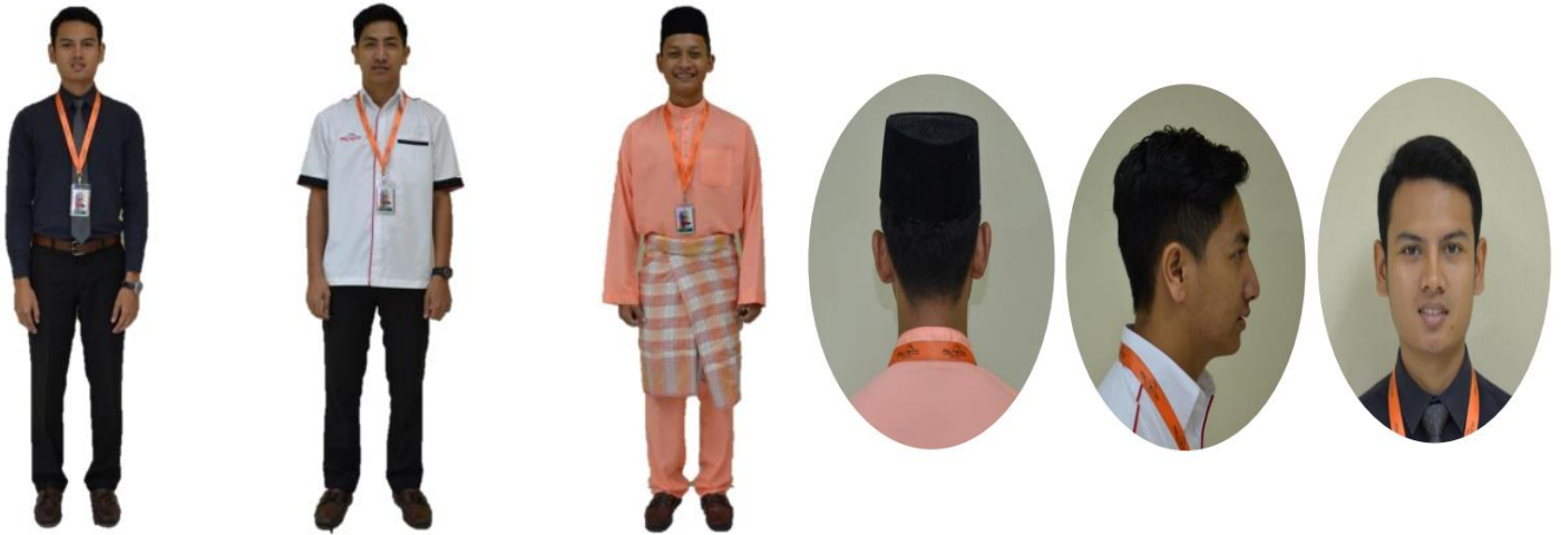
Rajah 1: Sahsiah Pelajar Lelaki