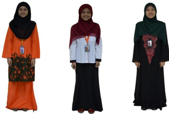
Rajah 2: Sahsiah Pelajar Wanita